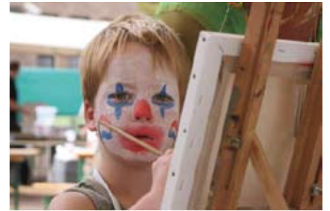
Het KinderKunst Atelier bleek een groot succes.

De ambities voor 2007 zijn groot. Het plan is om dat jaar een 'mega' Wild-live festival te organiseren. In 2007 bestaat het Wild-live festival alweer 5 jaar. Nu al hebben rond de 40 verschillende bands en artiesten