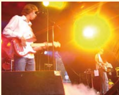
Funkatrankus speelt de het dak eraf.